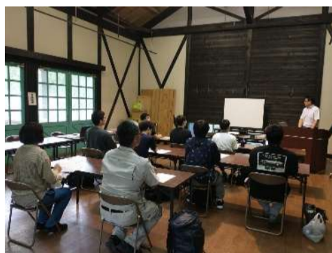
林業の基礎知識講習

林業の基本知識、林業体験、職場見学を行うとともに、個別の就職・生活相談を実施することで、林業に就職するために必要な知識や資格を身につけ、林業への円滑な就職を支援します。