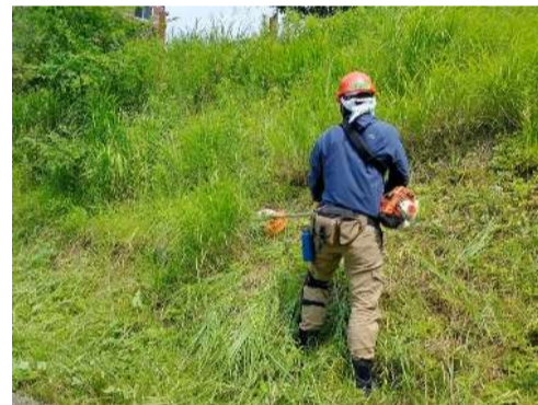
刈払機の実地講習