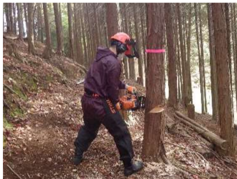
チェーンソーの実地講習