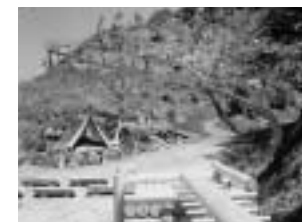
80mローラー滑り台「やまびこの森」 年中楽しめるシイタケ狩り