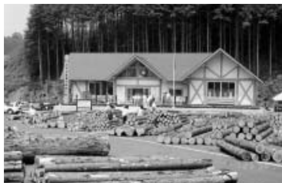
木材共販所(千早赤阪村)

木材共販所は、組合員から出材された大阪府内産材の原木を中心に市売りを行う施設で、2月1日に連合会から引き継ぎ、運営をしています。