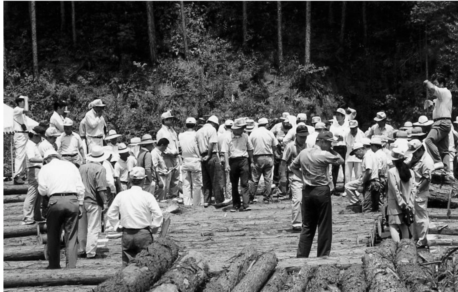
新しく森林組合の施設として仲間入りした木材共販所の木材市 (千早赤阪村)