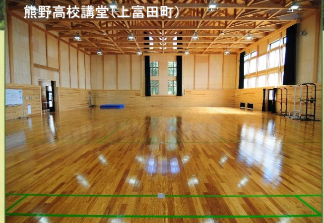
熊野高校講堂(上富田町)