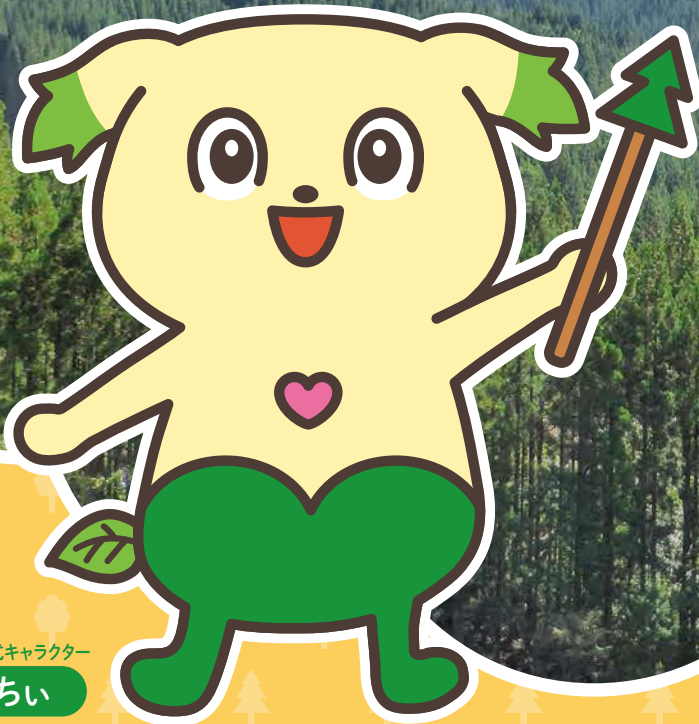
森林保険公式キャラクター