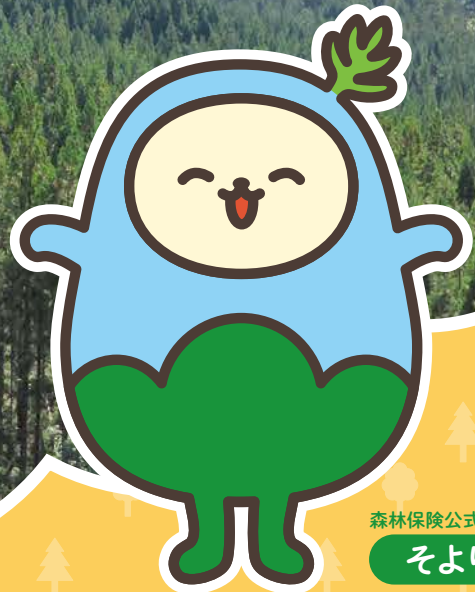
森林保険公式キャラクター